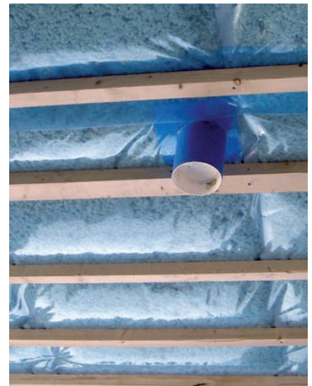
Höyrynsulun läpivienneissä käytetään läpivientikappaleita.