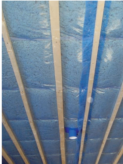
Höyrynsulku on limitetty kattoverhouksen koolauksen kohdalta.

Lopuksi tarkistetaan, että höyrynsulku on ehjä ja hyvin asennettu.